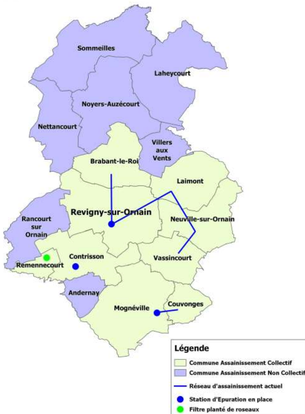
Figure 1 : L'assainissement dans les communes du territoire

Rapport annuel sur le prix et la qualité du service public d'assainissement non collectif